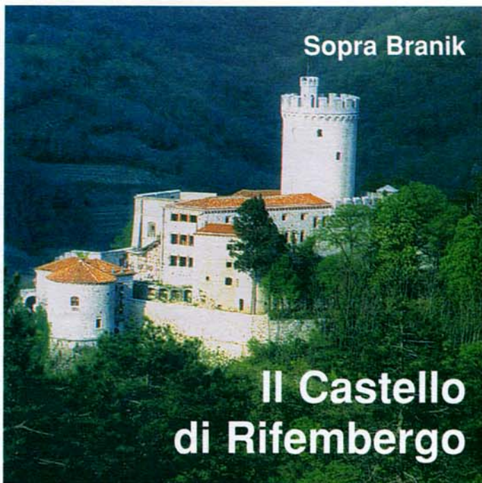
Sopra: il castello di Rifembergo, oggi.