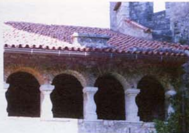
Sopra: tre immagini del castello.

obdržala do druge svetovne vojne. Leta 1713 so pun-tarski kmetje pritisnili tudi na ta grad in graščak je moral izročiti urbar.